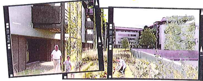
Jardins privatifs, Cour intérieure