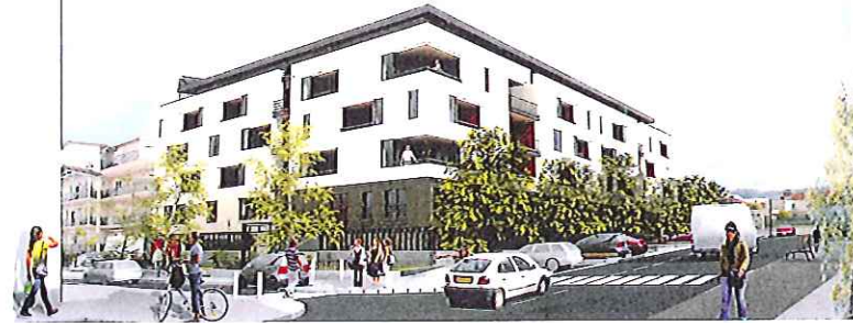
Vue du bâtiment C, Angle de la rue Dupuyrat et du Boulevard de Boissieu*