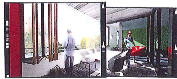
Vue sur le Château depuis la loggia, Appartements Bâtiments B B0111111