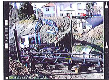
26 Mai 2009, Installation de la passerelle au site en présence des élus du conseil.