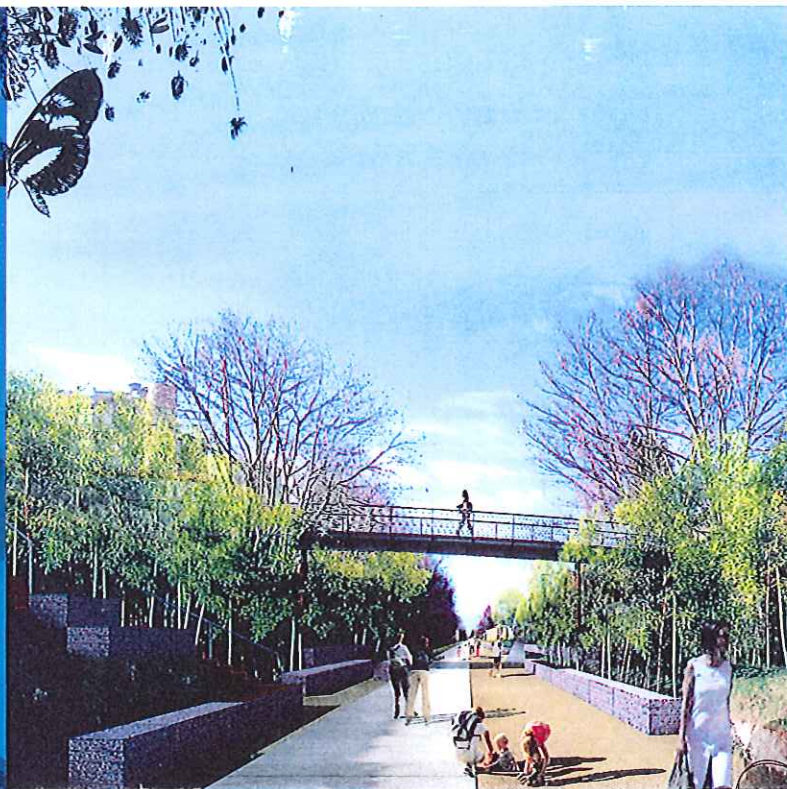
"La Voie Verte" 2012 (Future promenade au coeur de la ZAC Château-Bords de Loire) - Illustration : Ateliers G&P&R-MASSARI